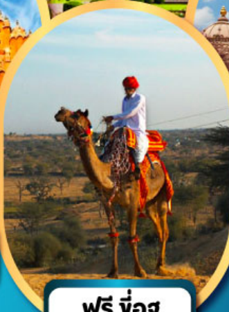
ฟรี ขี่อูฐ เมืองมันทาวา