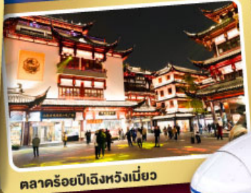
ตลาดร้อยปีเฉิงหวงเหมียว