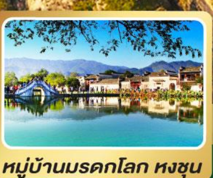
หมู่บ้านมรดกโลก หงชุน