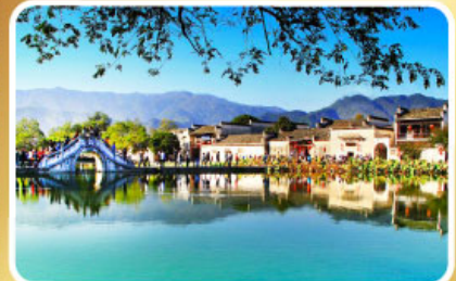
หมู่บ้านผดงโลก หงซุน