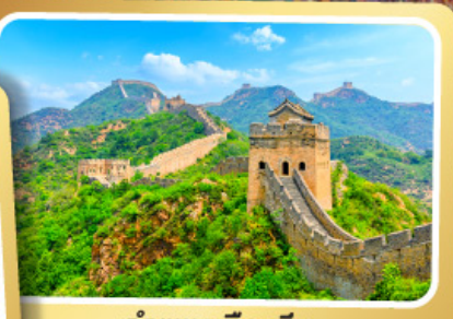
กำแพงเมืองจีน