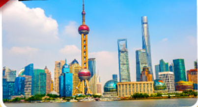
หอไข่มุก