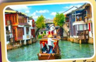
ล่องเรือเมืองโบราณซูโจวเจียว