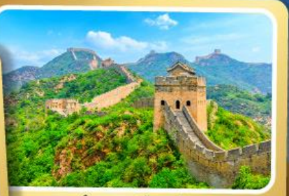
กำแพงเมืองจีน