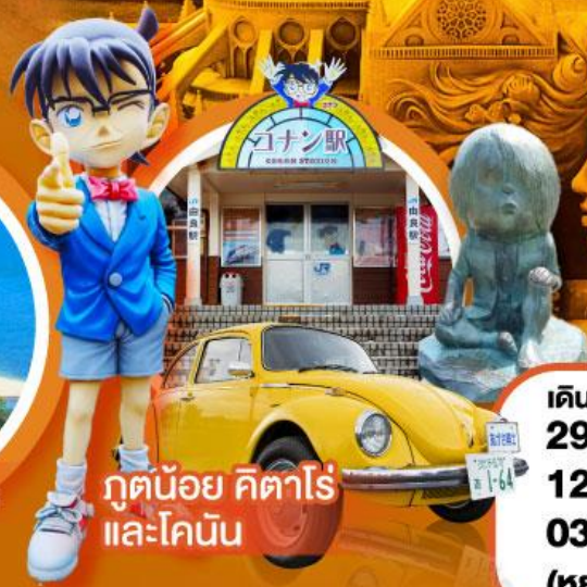
กูดน้อย คิตาโร่ และโคนัน

เดินทาง 29 ต.ค.-03 พ.ย. 67 12-17 พ.ย. 67 03-08 ธ.ค. 67 (หยุดยาววันพ้อ)