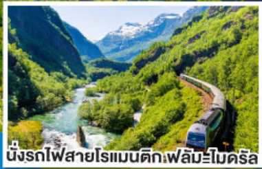
นั่งรถไฟสายโรแมนติกฟลัมโบโรคริส