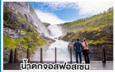
น้ำตกจอสฟอสเซ่น