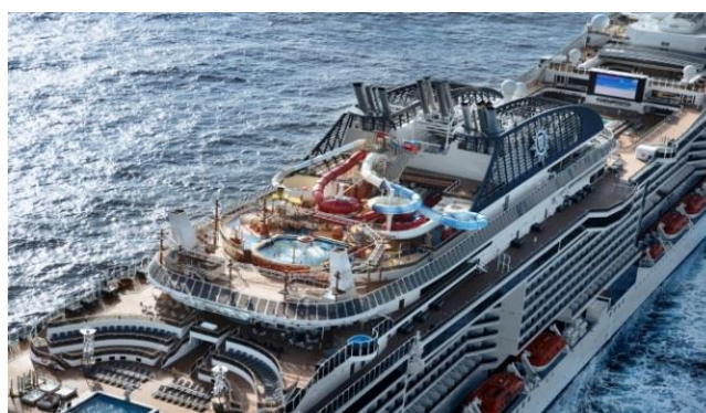
Keelung (Taipei, Taiwan)- Miyako Island-Naha(Okinawa)-Ishigaki(Japan)- Keelung –