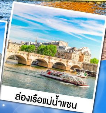
ล่องเรือแม่น้ำแซน

23-29 ก.ย. 67 07-13, 21-27 ต.ค. 67 04-10, 18-24 พ.ย. 67 02-08 ธ.ค. 67