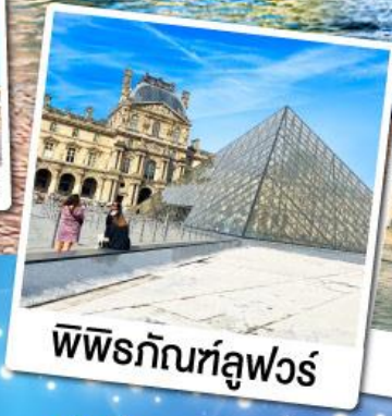
พิพิธภัณฑ์ลูฟวร์