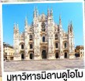
มหาวิหารมิลานดูโอโม

เมนูพิเศษ! หอยเอสคาโก้ อาหารไทย, ฟองดูชีส