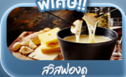
พิเศษ!! สวิสฟองดู