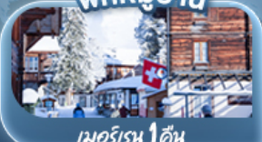
พักหมู่บ้าน