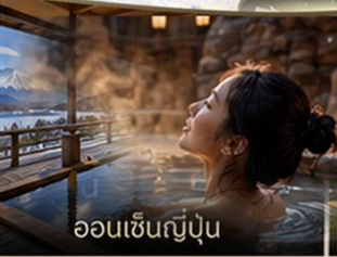
ออนเซ็นญี่ปุ่น