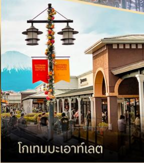
โทเทมเบเอาก์เล็ด