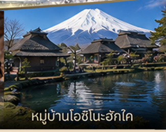
หมู่บ้านโอชิโนะอ๊กโค