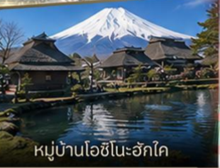
หมู่บ้านโอชิโนะอักษโค