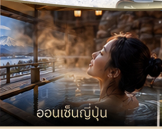
ออนเซ็นญี่ปุ่น