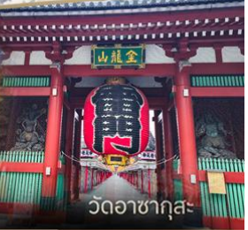
วัดวอดาซากุสะ