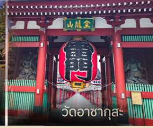
วัดอาสาซุกุสะ