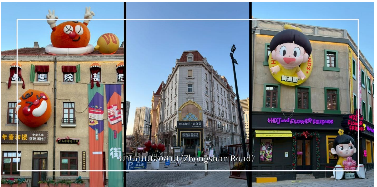
ย่านถนนจงซาน (Zhongshan Road)

นำท่านเดินชมบรรยากาศบน ถนนจงซาน (Zhongshan Road) ถนนสายเก่าแก่ใจกลางเมืองชิงเต่า ที่เต็มไปด้วยเสน่ห์ของอาคารสไตล์ยุโรปยุคอาณานิคมและกลิ่นอายเมืองท่าริมทะเลอันคึกคัก ถนนสายนี้ถือเป็นย่านการค้าสำคัญในอดีต ปัจจุบันเต็มไปด้วยร้านค้า ร้านอาหาร คาเฟ่ และร้านของฝากท้องถิ่นให้เลือกซื้ออย่างเพลิดเพลิน