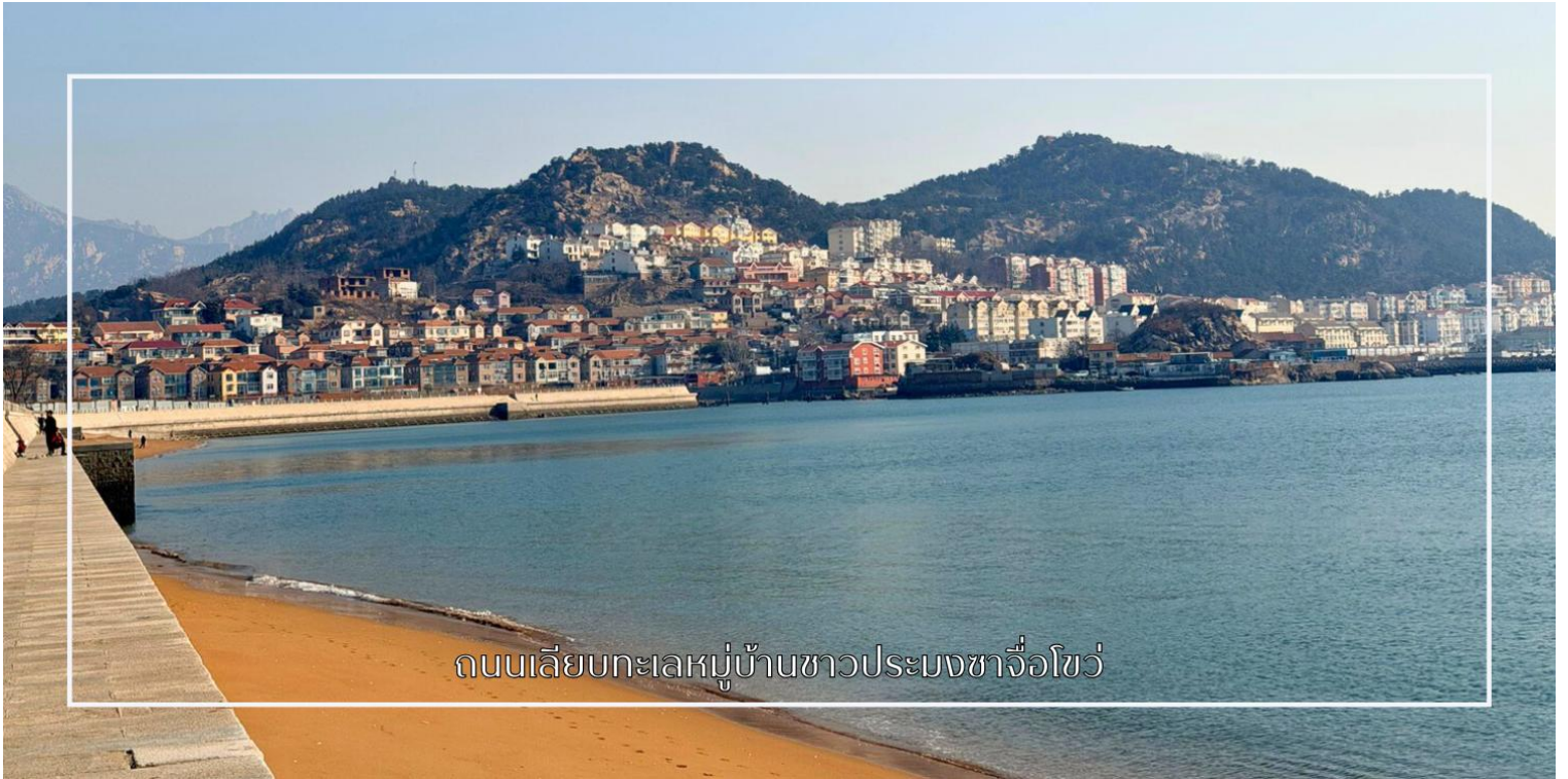
ถนนเลียบบทะเลหมู่บ้านชาวประมงซาโจว