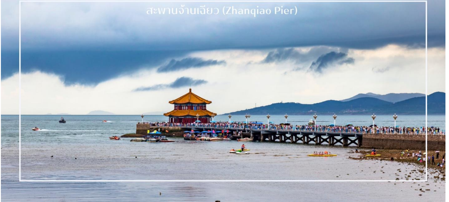
สะพานจ้านเจียว (Zhanqiao Pier)

นำท่านเดินชมบรรยากาศบน ถนนจงซาน (Zhongshan Road) ถนนสายเก่าแก่ใจกลางเมืองชิงเต่า ที่เต็มไปด้วยเสน่ห์ของอาคารสไตล์ยุโรปยุคอาณานิคมและกลิ่นอายเมืองท่าริมทะเลอันคึกคัก ถนนสายนี้ถือเป็นย่านการค้าสำคัญในอดีต ปัจจุบันเต็มไปด้วยร้านค้า ร้านอาหาร คาเฟ่ และร้านของฝากท้องถิ่นให้เลือกซื้ออย่างเพลิดเพลิน