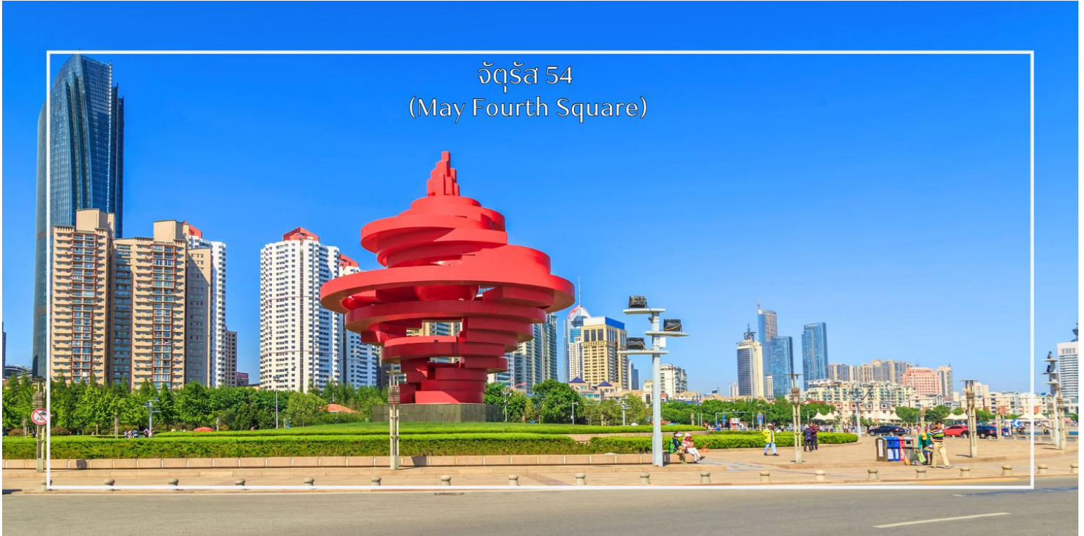
จัตุรัส 54 (May Fourth Square)

หลังอาหารเช้า นำท่านสู่ จัตุรัส 54 (May Fourth Square) แลนด์มาร์กสำคัญริมชายฝั่งทะเลของเมืองชิงเต่าโดดเด่นด้วย ประติมากรรมเรือใบสีแดงสูงตระหง่าน ที่เป็นสัญลักษณ์ของเมือง พร้อมพื้นที่กว้างขวางสำหรับเดินเล่นและถ่ายภาพบรรยากาศทะเลอ่าวชิงเต่า จัตุรัสแห่งนี้เป็นจุดพักผ่อนยอดนิยมและศูนย์กลางกิจกรรมสำคัญของเมือง