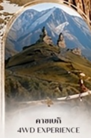
คาสเบกี 4WD EXPERIENCE