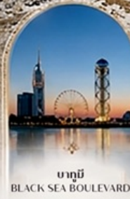
บาทุบี BLACK SEA BOULEVARD