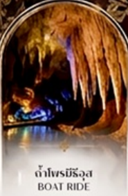
ดำโพรมิริอัส BOAT RIDE