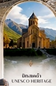
มัทสเคต้า UNESCO HERITAGE