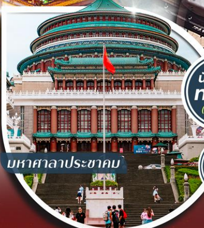
มหาศาลาประชาชน