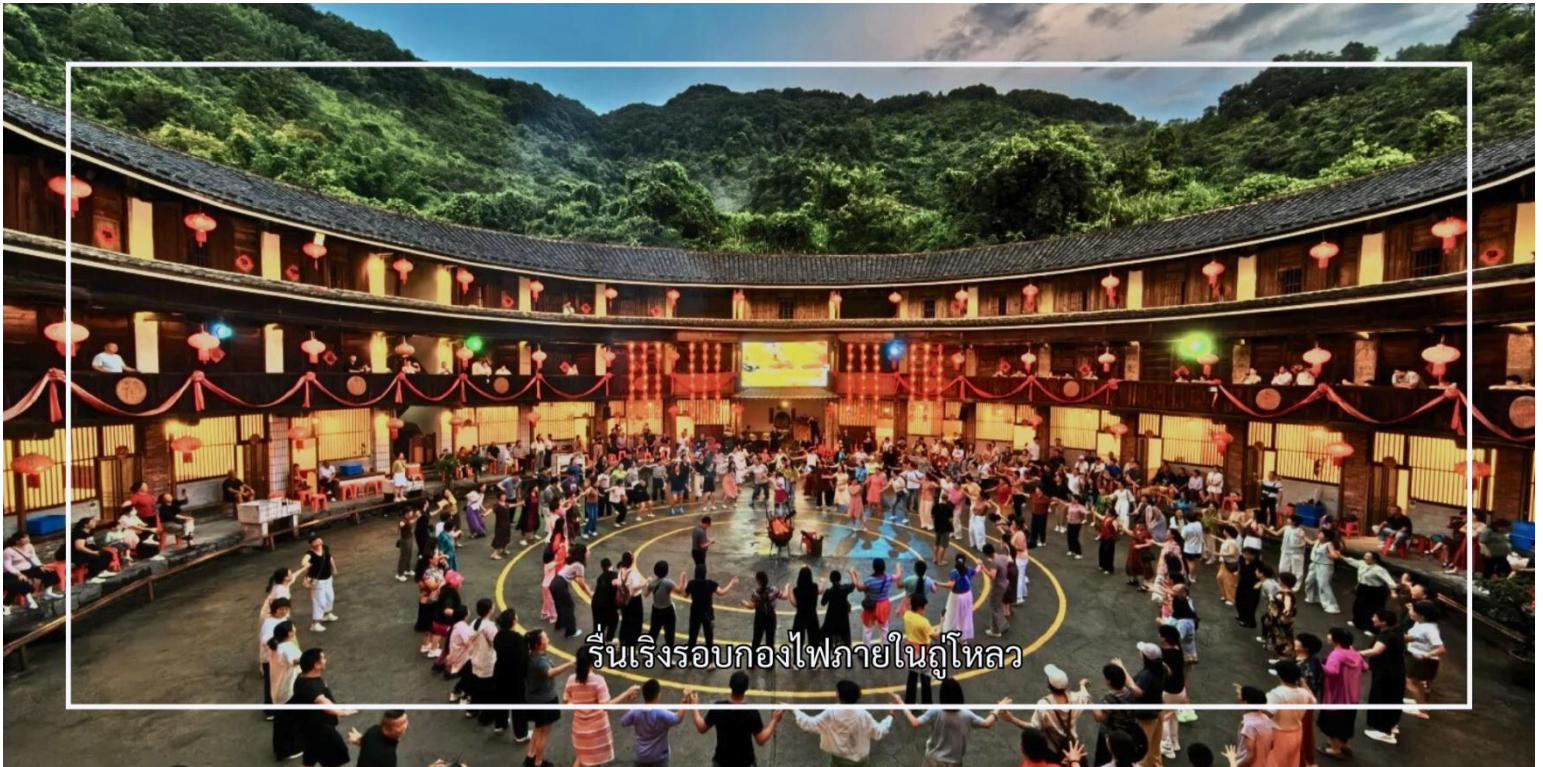
รื่นเรีงรอบกองไฟภายในภูโหลว

นำท่านชม กลุ่มบ้านดินหมู่บ้านหนานเจียง เป็นหนึ่งในกลุ่มภูโหลวของชาวฮากกาที่มีชื่อเสียงและทรงคุณค่าทางประวัติศาสตร์ ได้รับการยกย่องว่าเป็นตัวอย่างอันโดดเด่นของสถาปัตยกรรมพื้นบ้านจีน และเป็นส่วนหนึ่งของมรดกโลกทางวัฒนธรรม กลุ่มบ้านดินหนานเจียงประกอบด้วยภูโหลวขนาดใหญ่หลายหลัง ทั้งทรงกลมและทรงสี่เหลี่ยม สร้างขึ้นจากดินอัด ไม้ และหิน โครงสร้างแข็งแรงมั่นคง สามารถรองรับการอยู่อาศัยของคนจำนวนมากภายในอาคารเดียว ภายในจัดสรรพื้นที่อยู่อาศัย ลานกลาง และพื้นที่สาธารณะอย่างเป็นระเบียบ จากนั้นเชิญท่านร่วมกิจกรรมสนทนาการ รื่นเรีงรอบกองไฟภายในภูโหลว สัมผัสบรรยากาศยามค่ำคืนของชุมชนพื้นถิ่น เพลิดเพลินกับการแสดงพื้นบ้าน ดนตรี และการมีส่วนร่วมในกิจกรรมตามวิถีชีวิตดั้งเดิม สร้างความประทับใจและความทรงจำอันอบอุ่นระหว่างการเดินทาง