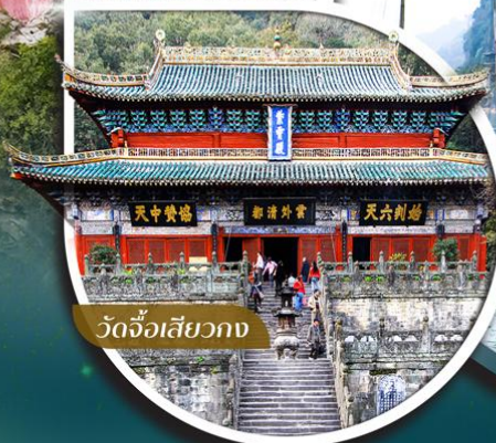
วัดจื่อเสียวกวง