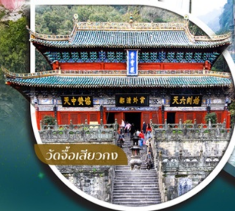
วัดจิวเสียวกวง