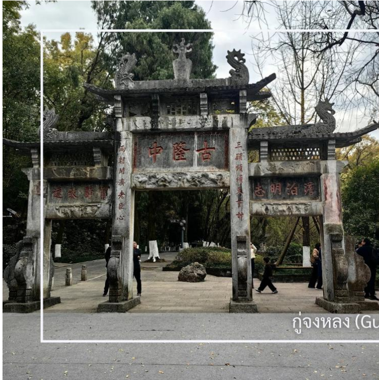
กุหลองจง (Gulongzhong)

หลังอาหารเช้านำท่านสู่ กุหลองจง (Gulongzhong) แหล่งท่องเที่ยวทางประวัติศาสตร์และวัฒนธรรมที่มีชื่อเสียง ตั้งอยู่ใกล้เมืองเซียงหยาง เป็นสถานที่พำนักของ จูกัดเหลียง (ซงเบ้ง) นักปราชญ์และนักยุทธศาสตร์ผู้ยิ่งใหญ่แห่งยุคสามก๊ก สถานที่แห่งนี้ในอดีตคือสถานที่ที่เล่าปี่ได้เดินทางมาพบกับจูกัดเหลียงที่เชิญตัวไปร่วมทัพ ปัจจุบันสถานที่นี้โอบล้อมด้วยธรรมชาติ สะท้อนบรรยากาศแห่งการศึกษา และวางแผนการเมืองในอดีต พร้อมให้ท่านได้เรียนรู้เรื่องราวทางประวัติศาสตร์อันทรงคุณค่า พร้อมสัมผัสบรรยากาศที่เชื่อมโยงกับตำนานและภูมิปัญญาจีนโบราณ จึงนับเป็นจุดหมายสำคัญสำหรับผู้ที่สนใจประวัติศาสตร์ยุคสามก๊ก และวัฒนธรรมจีน