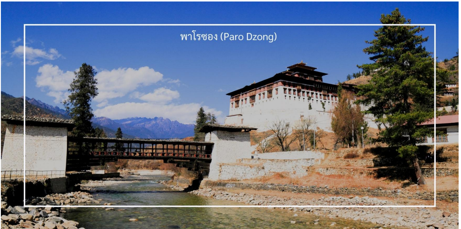
พาโรซอง (Paro Dzong)

เที่ยวชม พาโรซอง (Paro Dzong) เป็นหนึ่งในสถาปัตยกรรมที่สำคัญและสวยงามที่สุดในภูฏาน ตั้งอยู่ในเมืองพาโร (Paro) และมีบทบาทสำคัญทั้งในด้านศาสนาและการปกครอง สร้างขึ้นในปี 1646 เพื่อใช้เป็นที่ทำการของรัฐบาลและวัดประจำเมือง พาโรซองเป็นสัญลักษณ์ของความเข้มแข็งและความเป็นอิสระของภูฏาน