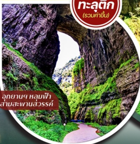
อุทยานฯ หลุมฟ้า สามสะพานสวรรค์