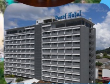
โรงแรมเพิร์ล