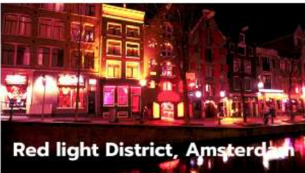
Red light District, Amsterdam