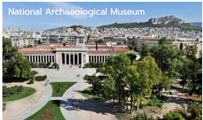
ยุคไมซีนี ฮัยปติโบราณ และยุคคลาสสิก