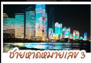
ซ่าชแดดหมาขเลข 3