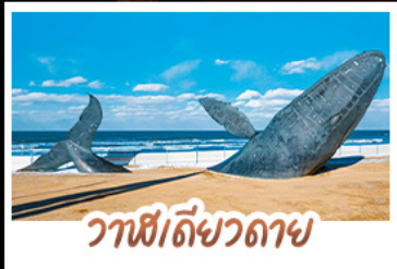
วาฬโต้วลาย