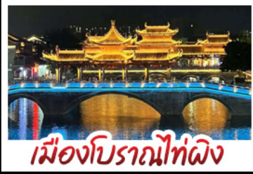
เมืองโบราณไท่ผิง

ส่งเรือน้ำตกตึกแก้ว - ทำเรือกังจ้อ พาชมสวนดอกไม้ตามฤดูกาล - หมู่บ้านสโตร์ยุโรป ถนนคนเดินสามตรอกสองซอย - เมืองโบราณไท่ผิง ถ้ำน้ำแข็งหลงทง เมนูพิเศษ อาหารเวียดนาม สุกี้ท่าม้า