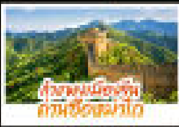
เที่ยวชมเมืองปักกิ่ง สถานชิวชิวชาวก๊อปปี้