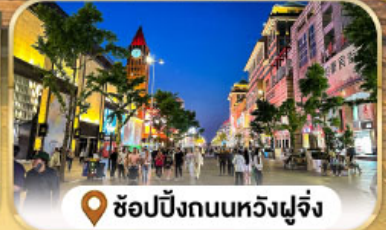
ช้อปปิ้งถนนหวังฝูจิ่ง