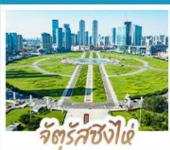
จัตุรัสชิงไฉ่