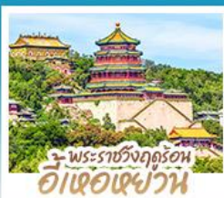
พระราชวังฤดูร้อน อี่เซว่เฉียว่วน

ทริปเดียวเที่ยว 2 เมือง ปักกิ่ง-ต้าเหลียน • เที่ยวจีนฟัลยูโรป ณ เมืองวนิสแห่งต้าเหลียน • สัมผัสประสบการณ์ขึ้นกำแพงเมืองจีน ด่านจวิยกวน • ซ้อป ซิม ซิล ที่ถนนโบราณคกงวนและย่านชานหลี่ถุน