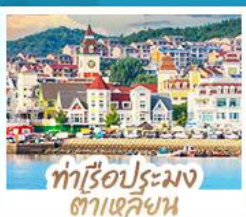
ท่าเรือประมง ต้าเหลียน