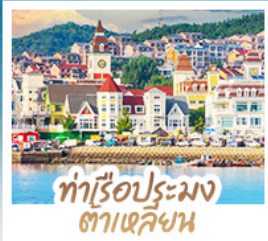
ทำเรือประมง ต้าเหลียน