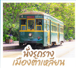
นั่งรถราง เมืองต้าเหลียน