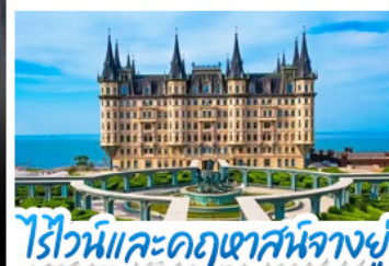
ไรไวน์และคฤหาสน์นางอยู่