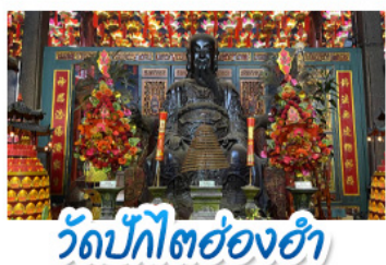
วัดปักไต้ฮ่องกง