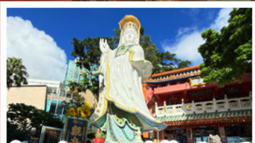
เจ้าแม่กวนอิมรัฟส์เบย์