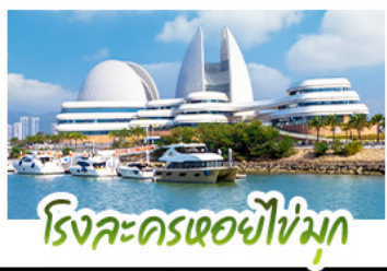
โรงละครเธียเตอร์ใหม่