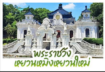
พระราชวัง เฉวานเหมิงเฉวานฮีเหม่