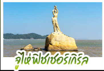
จูไห่ฟิชเชอร์รี่เกิร์ล