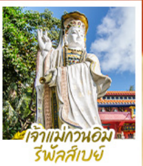
เจ้าแม่กวนอิม รีฟาส์เบย์