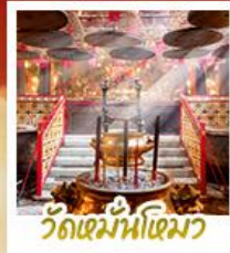
วัดมื่นไทมว