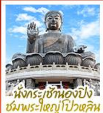
นั่งกระเช้ามองปิง ชมพระใหญ่ไป๋หลิม

นั่งกระเช้ามองปิงสีกการะพระใหญ่ไป๋หลิม • วัดหวังต้าเซียน ขอพรสุขภาพ ความรัก วัดเขกงหนิว ขอพรองค์เขกง โชคลาภ การเงินและธุรกิจ • เจ้าแม่กวนอิมรพีลาลัย ธิพพลังานติ เสริมพลังชองจ้อย • วัดมื่นไทมว ขอพรเรื่องการศึกษา การงาน สติปัญญาและความกล้าหาญ