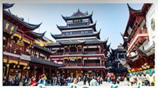
ตลาดร้อยปีเฉิงหวงเหมียว