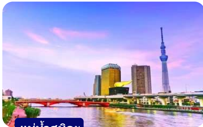
แม่น้ำสุมิดะ

ส่วนไฮไลต์สำคัญของวัดนี้คือ ไดคอน หรือหัวไข่เต่า สัญลักษณ์ศักดิ์สิทธิ์ คนที่นี้เชื่อว่าไดคอนช่วย "ชำระล้างสิ่งไม่ดี" และนำโชคลาภเข้ามา นักท่องเที่ยวมักนำไดคอนไปถวายเพื่อขอพร