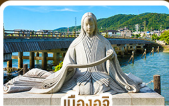
เมืองอูจิ สวรรค์คนรักชาเขียว

คามิโดจิ สวรรค์บนดินแห่งเทือกเขาแอลป์ ชมสะพานคิปปาบาชิ ชมวัดเนียวโดอิน • เมืองทาดายาม่า • ตลาดปลานิชิกิ • ช้อปปิ้งชินโซบาชิ • อีออนมอลล์