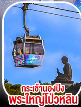
กระเซ้าองบิง พระใหญ่โป้วหลิน