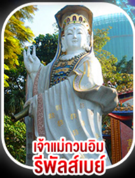
เจ้าแม่กวนอิม รีฟัลส์เบย์