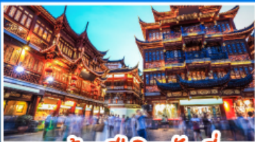
ตลาดร้อยปีเมืองเซี่ยงไฮ้