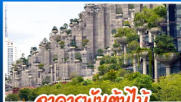
อาคารพันต้นไม้อาณาจักร TIAN AN 1000 TREES