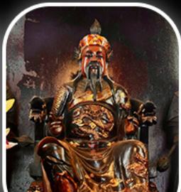
วัดปิกโต