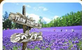
โทมิตะฟาร์ม