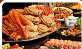
บุฟเฟ่ต์ซาซู+ชาปู 3 ชนิด