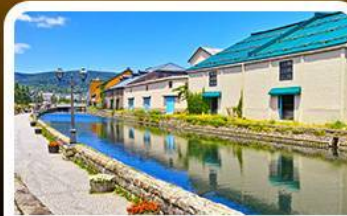
คลองไอตารุ