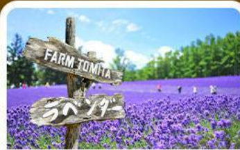
โทมิตะฟาร์ม