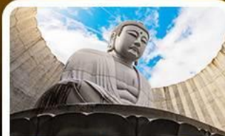
เป็นเขาแห่งพระพุทธรเจ้า