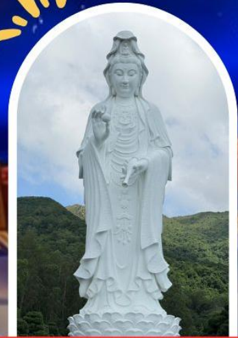
วัดซีซัน