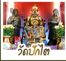
วัดป้กโต