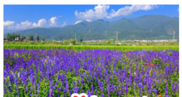
สวนดอกไม้ฮาวอวี่มู่ฉ่าง