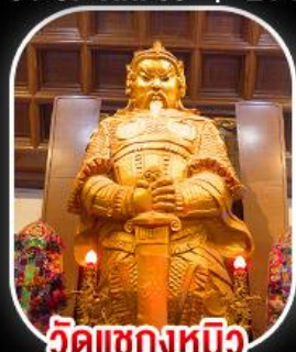
วัดเขกเหมียว

วัดเขกเหมียว- วัดเจ้าแม่กวนอิมฮ่องกง พระใหญ่ไผ่หลิน + กระเช้าแองปิง เมนูสุดพิเศษ!! ต้มชาฮ่องกง บุฟเฟ่ต์ชาบูสไตล์ฮ่องกง และห่านย่าง อิสระท่องเที่ยวดิสนีย์แลนด์ 1 วัน เลือกซื้อบัตรดิสนีย์แลนด์หรือช้อปปิ้งจุใจ