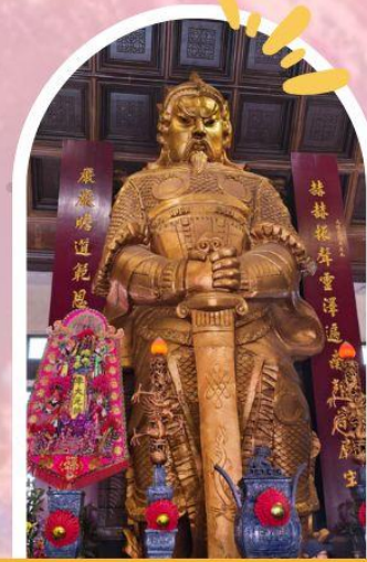
วัดแซกง ขอพรโชคลาก การเงิน และธุรกิจ