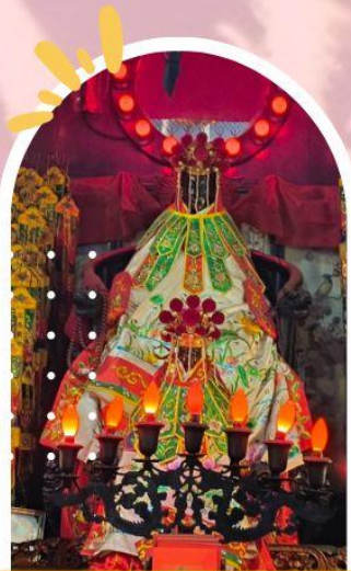
วัดเจ้าแม่กวนอิมฮ่องกง ขอพรเรื่องเงิน ทรัพย์สิน และความมั่งคั่ง