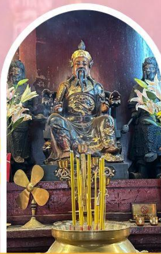
วัดปักไต้ฮ่องกง