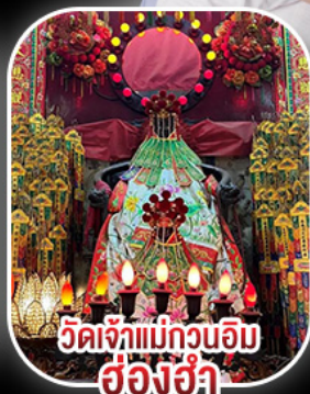
วัดเจ้าแม่กวนอิม ฮ่องฮ่า