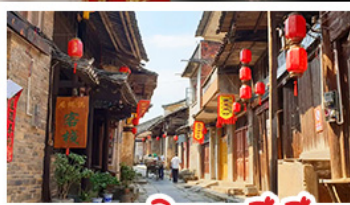
ถนนคนเดินตงซีเซียง