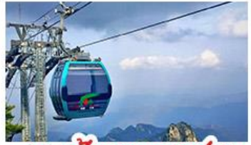
กระเช้าเขาหยงชาน