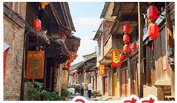
ถนนคนเดินตงซีเซียง