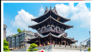
เจดีย์หยงชาน