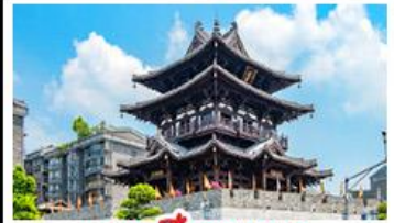
หอเซียวหยง