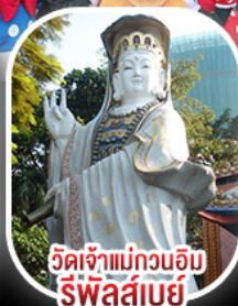
วัดเจ้าแม่กวนอิม รีพัลส์เบย์