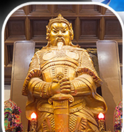
วัดเขangkงหมิว