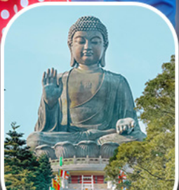
พระใหญ่โป่วหลิน