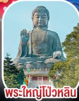
พระใหญ่โป่วหลิน