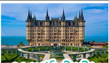
คฤหาสน์หวนเจิง