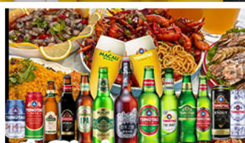
เบียร์ซิงเต่า + อาหารทะเล