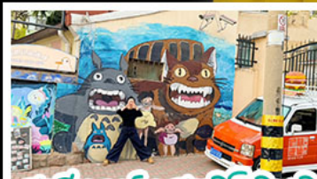
สตรีทอาร์ต สตุตโฮจิบลิ