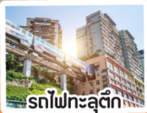
รถไฟฟ้าทะลุติ๊ก