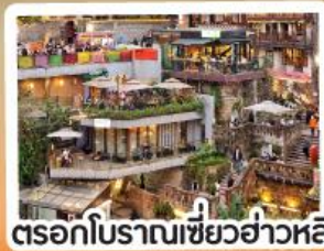
ตอรอกโบราณเขี้ยวฮ่าวหลี่