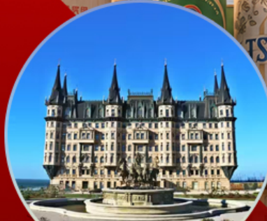
คฤหาสน์เวินเจิง