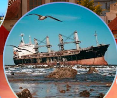
เรืออัปปาง Blueways