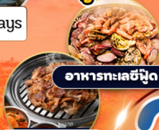
อาหารทะเลซีฟู้ด