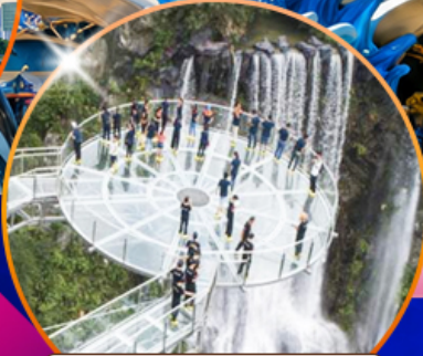
สะพานแก้วคู่หลงเซี่ยะ