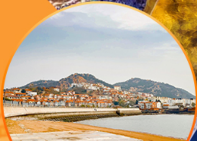
ซาจี้โป๋