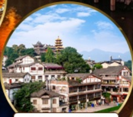
เมืองโบราณฉือฉีโป่ว